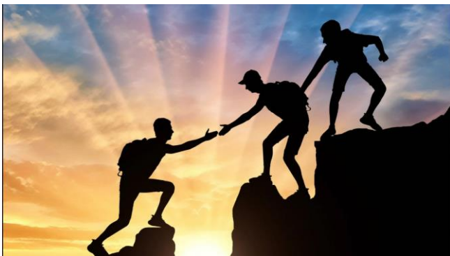
Bild zum Thema Vertrauen: